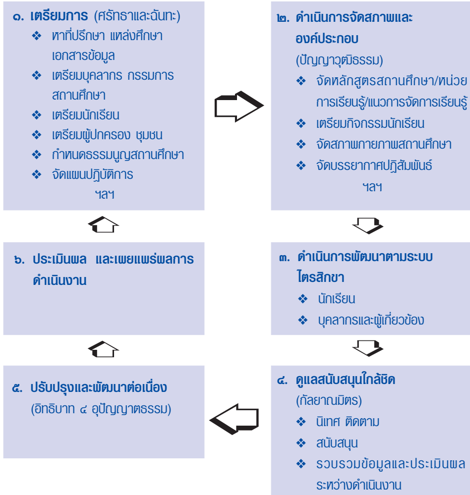
แผนภาพการบริหารจัดการโรงเรียนวิถิพุทธ